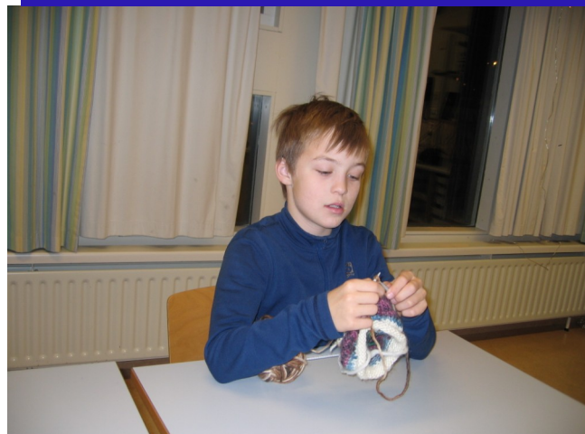
Janus stendur sig vel við þrjónaskapinn