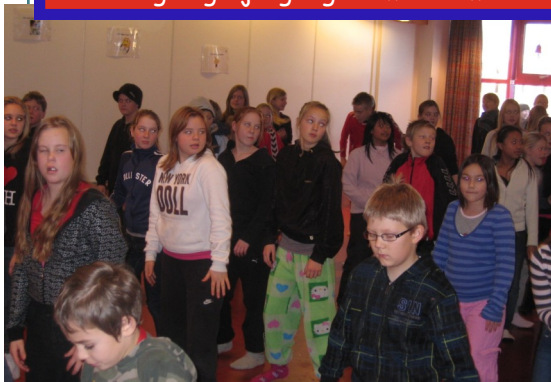
Góð einbeiting í dansinum