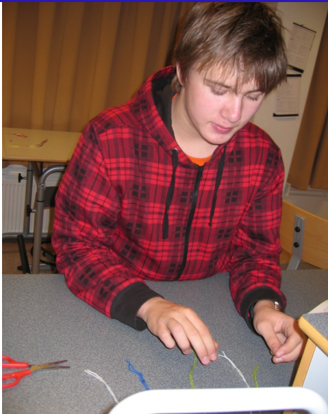
Gunnar Þór alltaf jafn duglegur